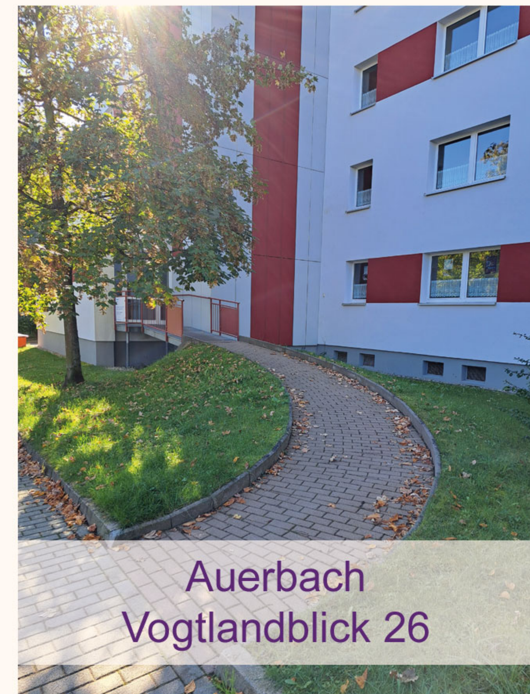
Auerbach Vogtlandblick 26