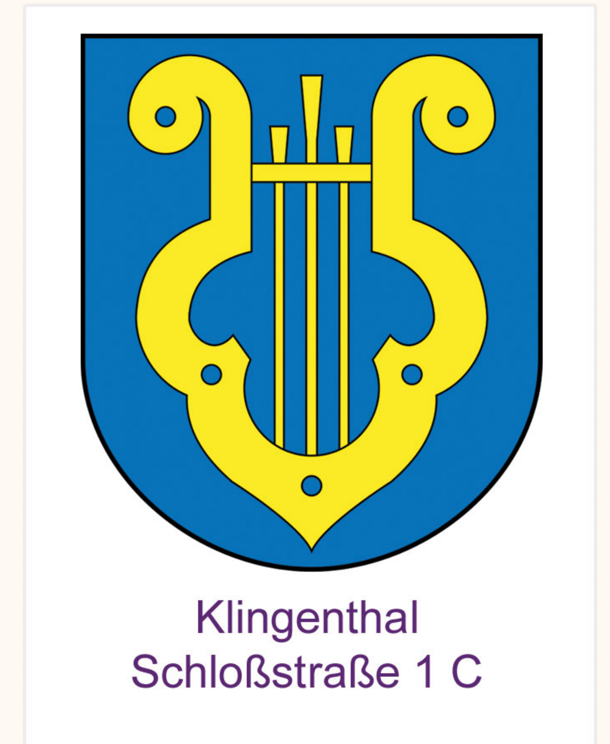
Klingenthal Schloßstraße 1 C