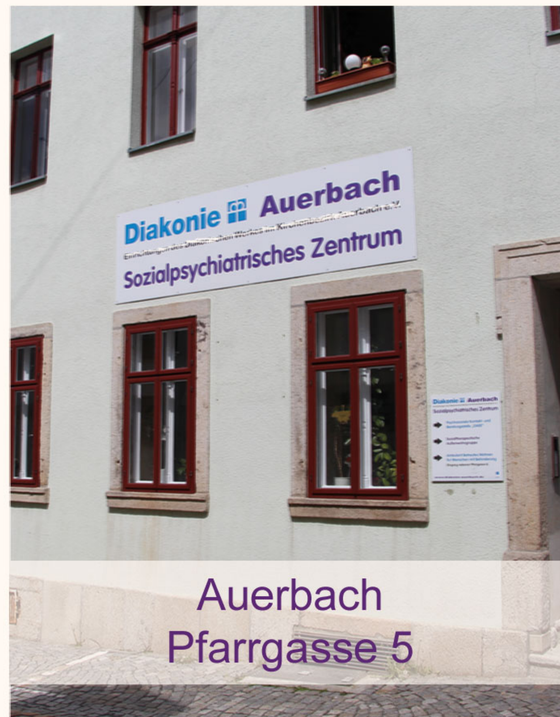
Auerbach Pfarrgasse 5

Gleichzeitig wollen wir der sozialen Isolation entgegenwirken und die Kompetenzen für eine selbständige Lebensführung stärken.